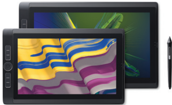
Wacom MobileStudio Pro 13 & 16 Artyści: Santtu Mustonen i Future Deluxe

Zaprojektowany tak, abyś mógł swobodnie tworzyć wszędzie, Wacom MobileStudio Pro zawiera pełen zestaw potężnych kreatywnych narzędzi, tworzących linię lekkich, mobilnych komputerów piórkowych z najnowszym piórem Wacom Pro Pen 2 na czele. Poruszaj się płynnie w swojej pracy między 2D a 3D kiedykolwiek zechcesz tworzyć.