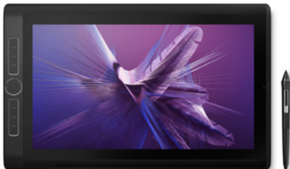
Wacom MobileStudio Pro 16 Autor grafiki: Feature Deluxe

Z Wacom MobileStudio Pro możesz tworzyć co chcesz, gdzie chcesz i kiedy chcesz. Wysokiej jakości wyświetlacz, precyzyjne piórko i większa moc obliczeniowa dają Ci pełną niezależność, a zaawansowane narzędzia, wyjątkowa grafika i długa żywotność baterii sprawiają, że nic nie stanie na drodze Twojemu natchnieniu.